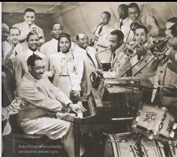
Duke Ellington et sa bande, pendant les années 1970.

Daisy, la mère de Duke, est une femme très religieuse, sévère et rigoureuse, un peu hautaine, douée d'un sens moral aigu, qui élèvera son fils dans le respect des convenances et la droiture. Duke sera entouré de toute l'attention et l'affection parentales, d'autant qu'il restera enfant unique jusqu'à l'âge de 16 ans et la naissance de sa sœur Ruth. Il sera élevé dans le confort, à l'abri de la misère, chose rare pour un enfant noir à cette époque.