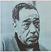
LOUIS ARMSTRONG (à gauche)