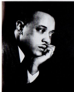
WILLIAM GRANT STILL